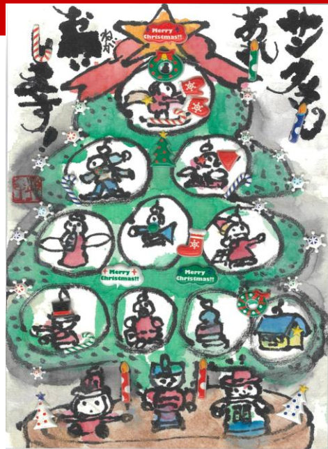
絵手紙教室「はなみずき」