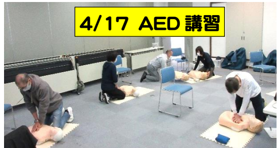
4/17 AED 講習