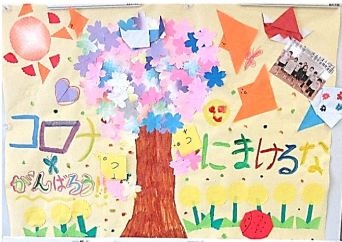
令和2年度 長浜小学校3年生より 地域の皆さんへ