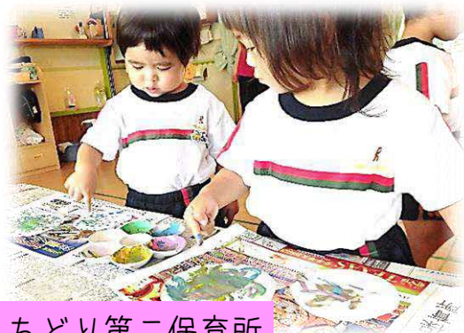
ちどり第二保育所