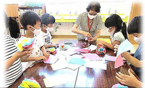
ハ朔花祭りに献花する花を地域の方と一緒に作りました