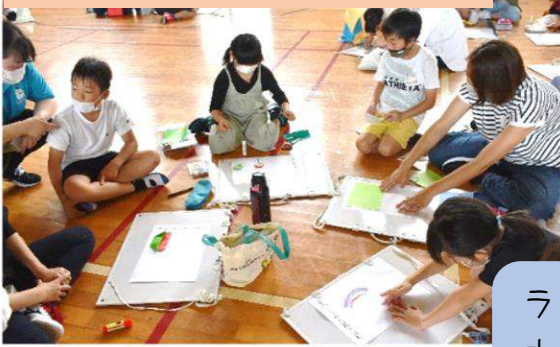
6/19 長浜小3年生親子活動