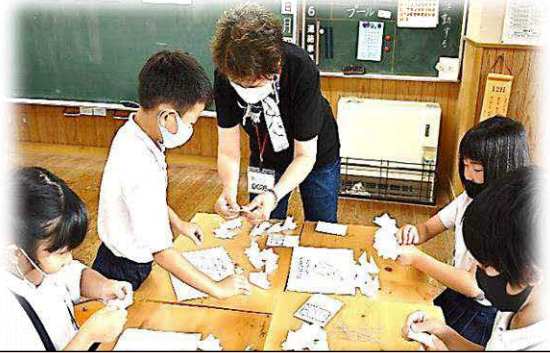
地域の方からハ朔花祭りの由来を聞き、伝統的な桜の花の作り方を教わりました