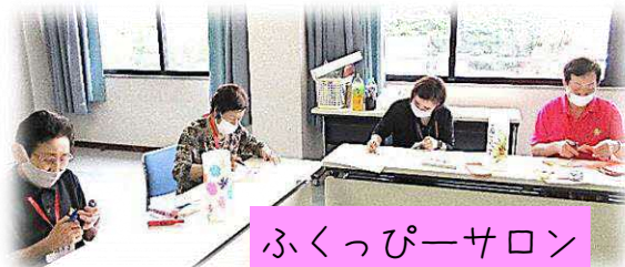
ふくっぴーサロン