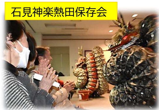
石見神楽熱田保存会