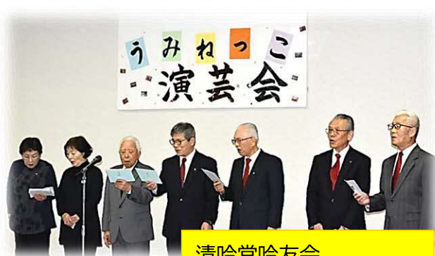
清吟堂吟友会 浜田ブロック朝日支部