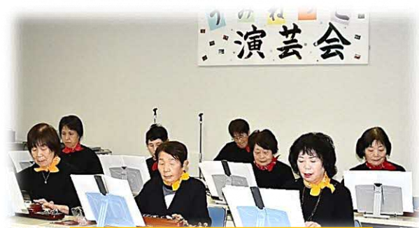
琴城流 大正琴 浜田支部