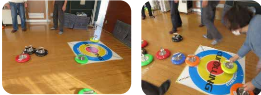
3月10日(木) 《カローリング大会》

リーグ戦の3試合を行いました。同点延長戦の白熱した試合もあり、参加者の方々は大変盛り上がりました。ココ・ソラーレが北京オリンピックで銀メダルを獲得したカローリングに類似したゲームです。手軽に出来るスポーツですので興味のある方はぜひ次回の参加をお待ちしております。