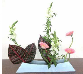
金魚草・ガーベラ・クロトン