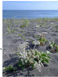
ハマポウフウの花

本来、生薬に用いる「防風」は私たちがよく知る「浜防風」とは異なる植物で、日本には自生しておらず姿形もかなり違ってきます。とはいえ同じセリ科であり、浜防風も防風の代用品になります。薬効は発汗、解熱・鎮痛ですが、いわゆる「薬」としてよりも馴染み深いところで、お正月に飲むお屠蘇（屠蘇散）にサンショウやキキョウなどと共に調合されているそうです。こう聞くと生薬にも親しみが感じられますね。