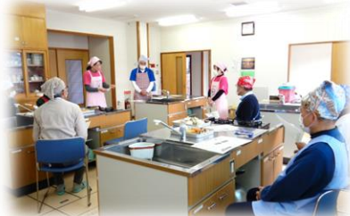
① 流れを確認します

令和5年2月14日(火)、まちづくりセンター事業で『男性料理教室』を実施しました。今回も食生活改善推進員さんにご指導いただき、うずめ飯、鮭のちゃんちゃん焼き、大根と卵のトロみスープ、デザートにはミルク寒天を作りました。普段あまり料理をされていないお父さんたちも包丁を握ると手際よく調理され、美味しい昼食ができました。