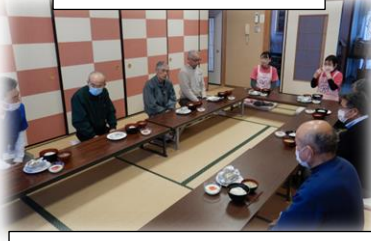
④みんなでいただきます！