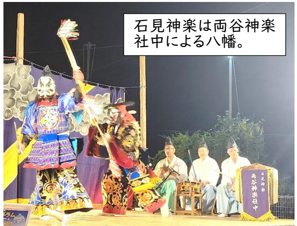
石見神楽は両谷神社社中による八幡。