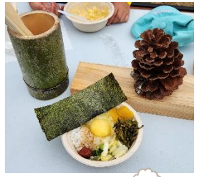
青少年地域活動チャレンジ事業