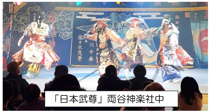
「日本武尊」両谷神楽社中