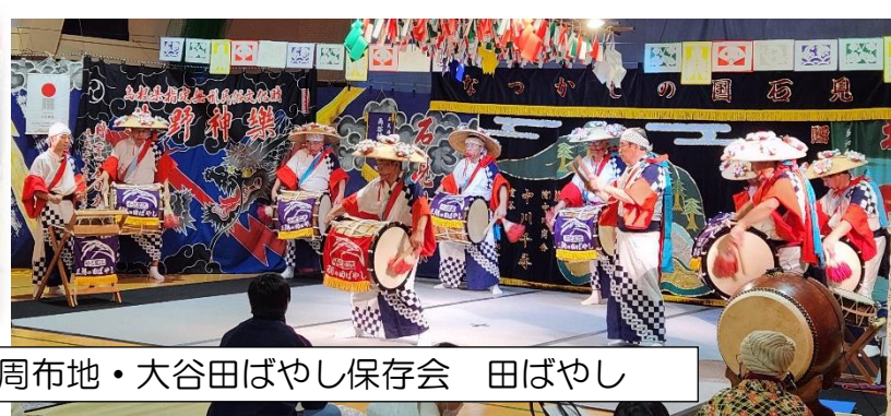
周布地・大谷田ばやし保存会 田ばやし