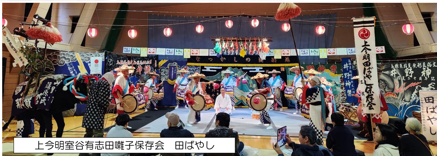
上今明室谷有志田囃子保存会 田ばやし

当日は雨天にもかかわらず、200人を超える来場があり、たくさんの方に井野地区に伝わる伝統芸能を観て頂くことが出来ました。井野の魅力・若者の活力を地域内外に伝えることができた集いになりました。