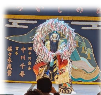
「鐘馗」両谷神楽社中