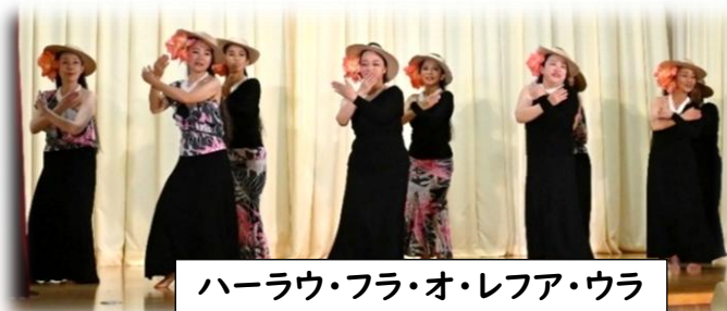
ハーラウ・フラ・オ・レファ・ウラ