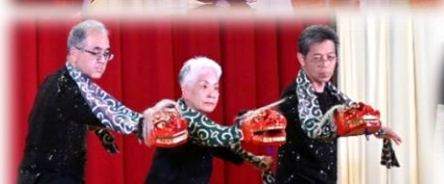
芦谷連合自治会銭太鼓グループ