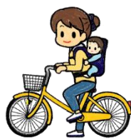
4歳未満の者を 確実に背負う