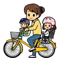
前形座席 + 後形座席