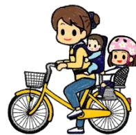
幼児座席 + 背負い（4歳未満）