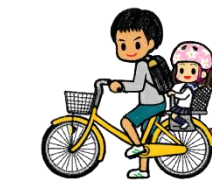
16歳未満の者が幼児を 乗せて運転するのはダメ