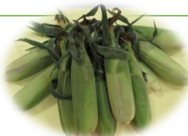
とうもろこし（皮つき）