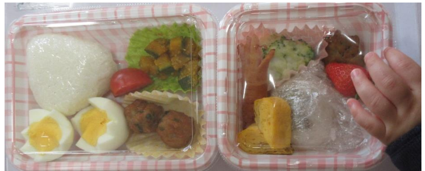
おべんとうが出来ました♡

ゆで卵にラップを巻き5本の箸で均等に囲み両端を輪ゴムで固定して少しおきます。花形の出来上がり！