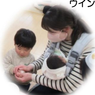
ラップおにぎり作成中!!