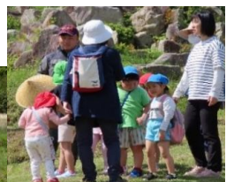
↑今福保育園も 応援