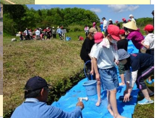
美又温泉のお湯で手足をきれいにしきさっぱり→