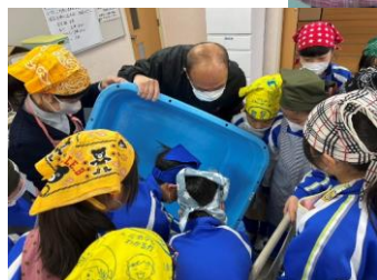
前日の米研ぎ。 お米一粒も大切に扱う姿。