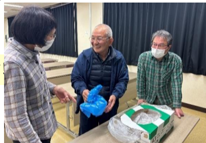
前回学んだ非常トイレの使い方を町内ごとに抜き打ちテスト!みなさんしっかり覚えておられました。