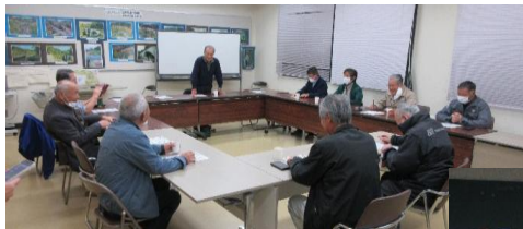
各町内の若手がサポート役で活躍しています

今福自主防災会は、本年度3、4度目となる情報伝達訓練を行いました。リーダー・班長を対象にLINEを用いた訓練を行い、災害時の連絡手順を確認しました。あわせて非常用トイレの使い方を学び、衛生管理の重要性と地域で備える大切さを再認識しました。