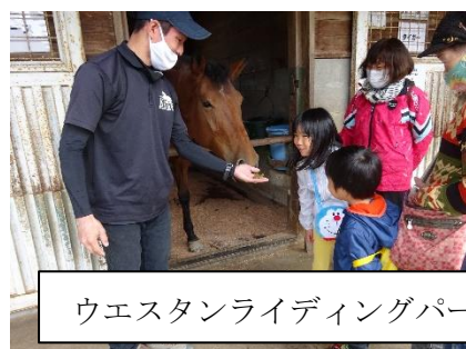
ウエスタンライディングパーク