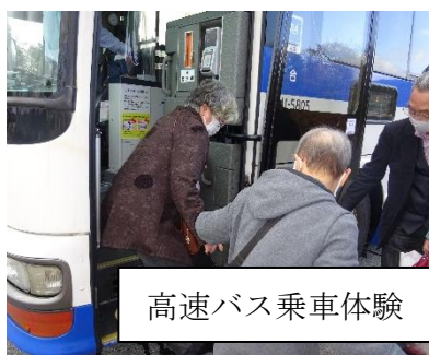
高速バス乗車体験