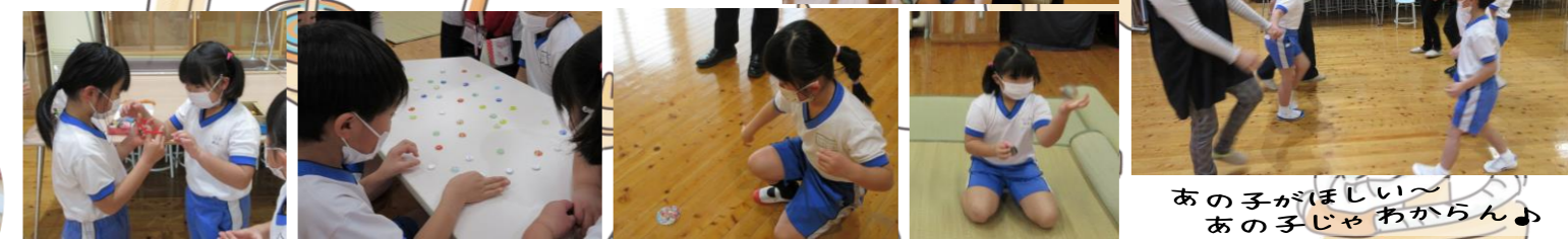
あの子がほしい〜 あの子じゃあからん♪