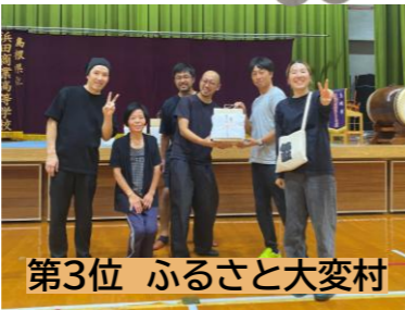
第3位 ふるさと大変村

第4回大会を制したのは、初出場の島根県立大学のモルック同好会でした。週2回練習をされているようで圧倒的な強さでした。これまでモルック大会を4回開催しましたが、どの大会もどのチームが優勝するのか全く分からないほどの接戦です。毎月1回モルック体験を開催しているので、たくさん練習して、優勝を目指しましょう！！ご参加いただきありがとうございました。