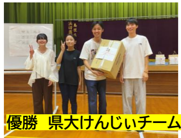
優勝 県大けんじいチーム