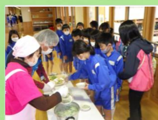
今年も元気な1年に!