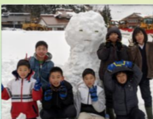
背丈以上の雪だるま完成!