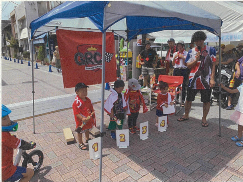
2 GoRiseCup in BB 大鍋フェスティバル