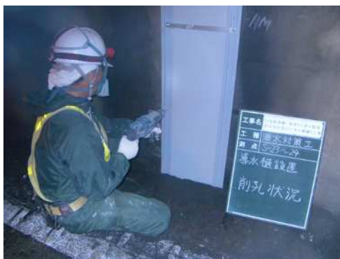
写真 4-2 線導水工