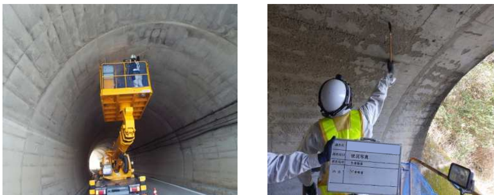
写真 3-1 トンネル点検状況

また、覆工表面のうき・はく離等が懸念される箇所に対し、うき・はく離の有無及び範囲等を把握する打音検査を行うとともに、利用者被害の可能性があるコンクリートのうき・はく離部を撤去するなどの応急措置を講じます。