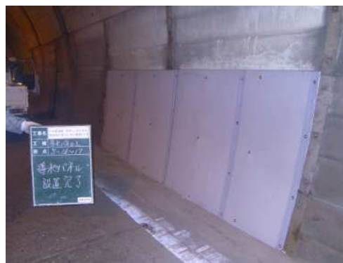
写真 4-3 面導水工