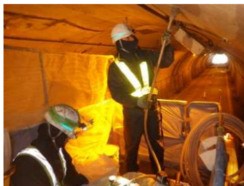
写真 4-4 裏込注入状況