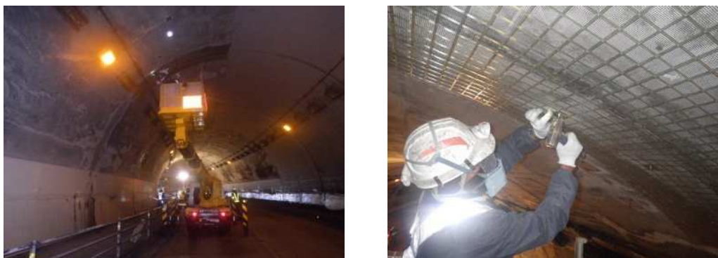
写真 4-1 FRP ネット設置状況

覆工コンクリートや既設補修・補強材のうき、はく離等に関して、落下防止又は変状拡大防止を目的として実施します。