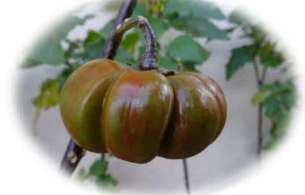
花茄子(色づいてきました)