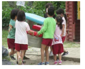
幼稚園ってたのしいな③ 力を合わせたらできるね