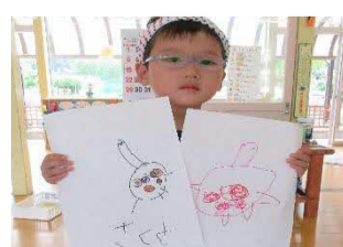
カメラを描きました。カメラ屋さんになります