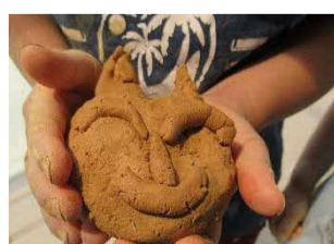
土粘土で作ったうさぎ