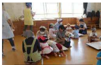
一昨年の様子から