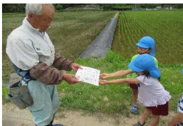
地域の方に感謝状