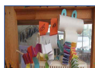
カエルをつかったよ