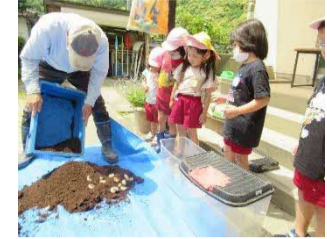
幼稚園ってたのしいな② 地域の人もやさしいよ