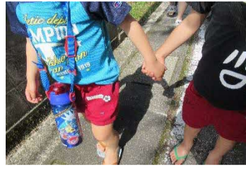
幼稚園ってたのしいな① 友達できたよ

入園した子ども達も幼稚園の生活に慣れてきました。 友達もできたよ……。幼稚園ってたのしいな……。