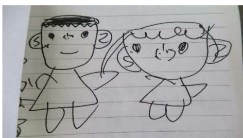
実習生の先生とわたし・・・