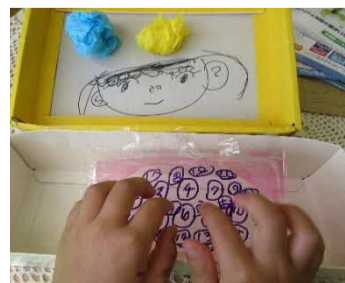
自分で作ったパソコン