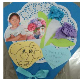
「お父さん、だいすき。戦いごっこしようね」