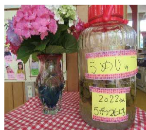
梅ジュースを作りました。