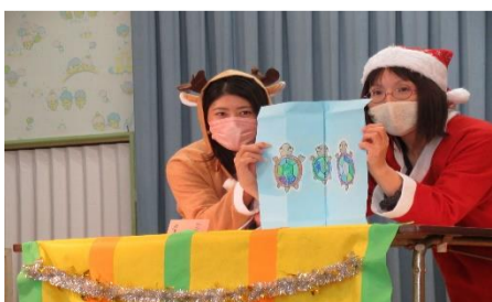
サンタさんとトナカイさんから おはなしのプレゼント