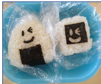
お父さんが作ったおにぎり第2弾