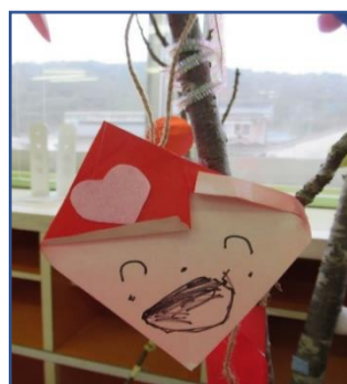
スマイルサンタさん