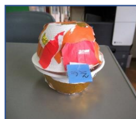
「先生、結婚おめでとう」