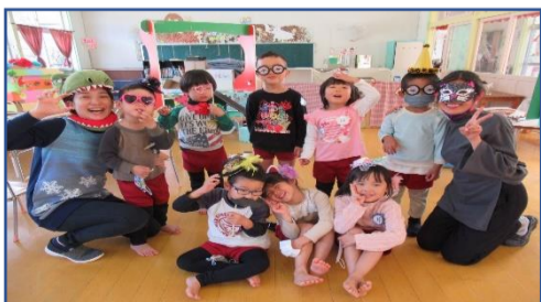
「ALTさんとハロウィンパーティー!」