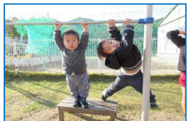
「お兄ちゃん達みたいにかっこいいでしょ?」