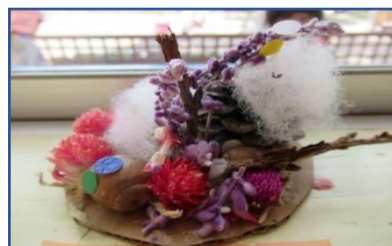
「お父さんとお母さんが木のお家にいるよ」