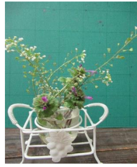
「ナズナ」と「ほとけのざ」を飾りました。