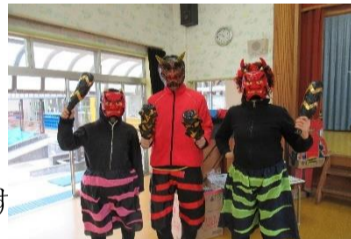
2月 節分の時の様子