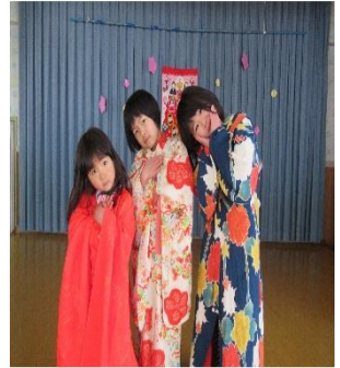
「鬼さんはおしまいよ。」「今度は私達の番よ!」美川幼稚園のお雛さま3人組です。