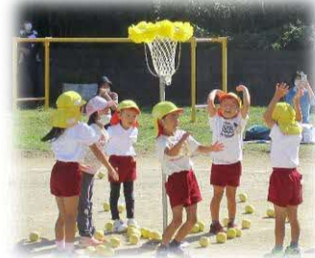
一生懸命玉を投げた玉入れ