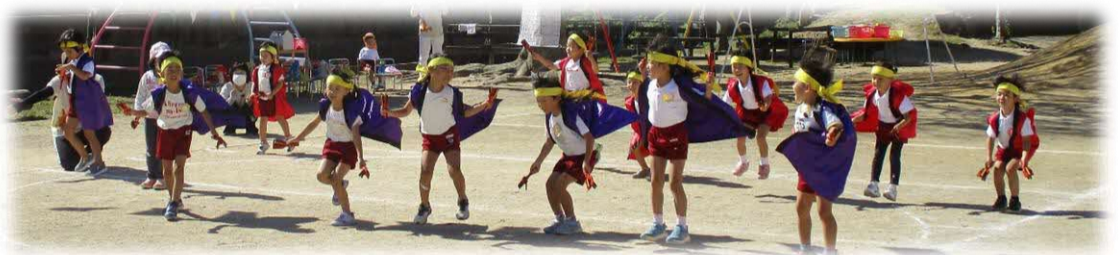
毎年恒例の『よさこい』です。