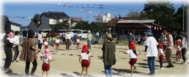
親子ダンスはおうちの人とふれ合う楽しい時間でした