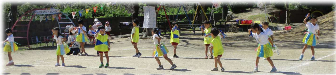
大好きな曲『ツバメ』のダンスです。自分達で振りを考えました。