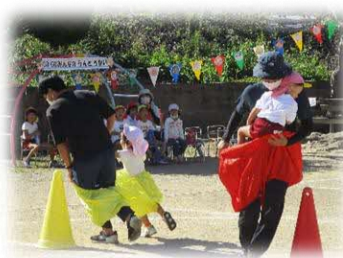
親子でデカパンリレー