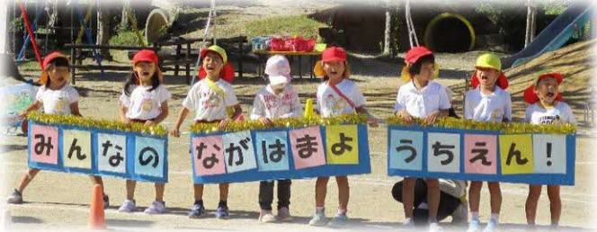
地域の海や園の横を走る瑞風をイメージした障害物競走1枚ずつめくった文字が完成すると『長浜幼稚園』に

お天気にも恵まれ、運動会日和でした。子ども達は当日をとっても楽しみにしていた子ども達は、自分の力を発揮しながら、チームで力を合わせていく楽しさを味わっていました。また、転んでもすぐに起き上がったり、友達を一生懸命に応援する姿も感動的でした。特に年長児はプログラムのアナウンスや競技の準備や片づけを主体的にしている、さすがリーダーという姿を見せていました。親子でも競技やダンスでふれ合って、素敵な思い出ができました。長浜幼稚園としての最後の運動会は子ども達の心にずっと残るものになったと思います。