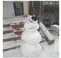
3人で作ったので3段の雪だるまになりました！