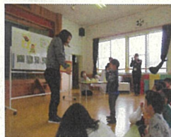
1月 七草の会の時の様子