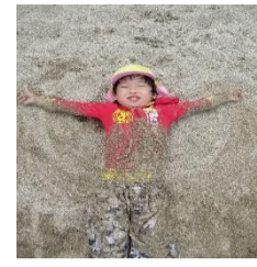
夏本番② 砂まみれマン