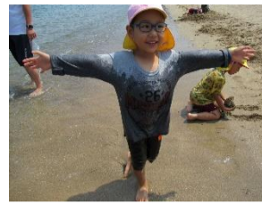
夏本番① びしょぬれマン