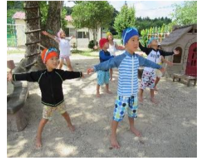
夏本番③ 水着でラジオ体操