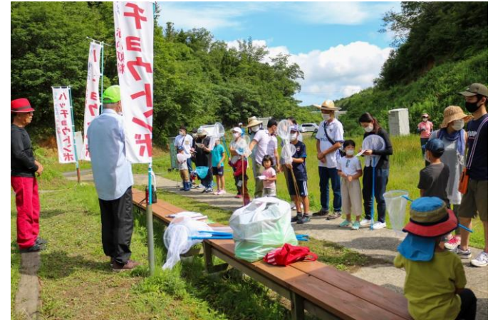
ハッチョウトンボ親子観察会

ふるさと郷育、はまだっ子共育、学びのあるまちづくりを通して、「人づくり」や「つながりづくり」に取り組みます