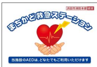
「まちかど救急ステーション表示証」

[まちかど救急ステーション認定制度] 誰もが使用することができる場所に常時使用可能な状態でAEDを設置し、救命講習等を修了した従業員等が所属している事業所等を「まちかど救急ステーション」として認定