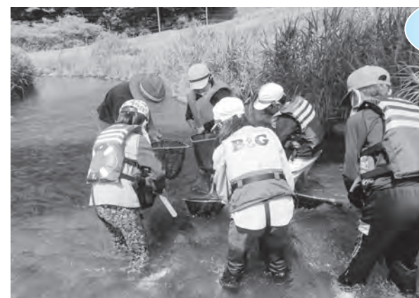
生き物を捕まえる