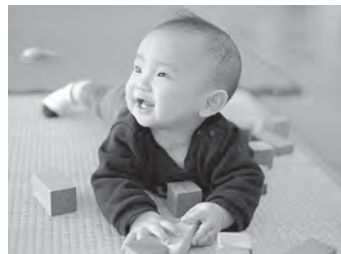
安心してお産できるための支援

高齢者の移動支援として、市内公共交通機関を半額で利用できる敬老福祉乗車券を販売し、通院や買い物への移動費の負担を軽減しました。また、お産の支援にも活用しました。