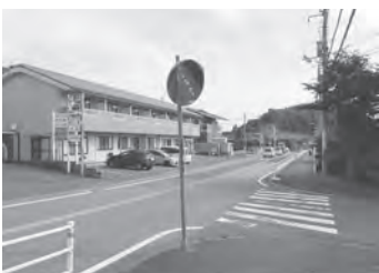
通学路にカーブミラーを設置

新型コロナウイルス感染症の感染拡大に備え、季節性インフルエンザの発症率を下げるため、予防接種の費用助成を行いました。また、通学時の安全を確保するため、通学路などの修繕・整備を行いました。