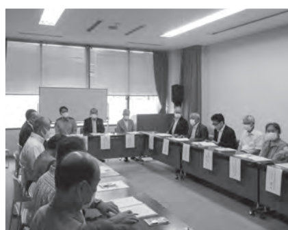
社会を明るくする運動浜田市推進委員会が開催されました(6月29日)