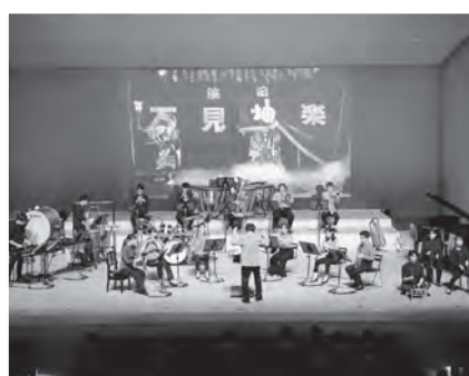
ハイブリッドウィンドオーケストラ第1回定期演奏会が開催されました(6月19日)