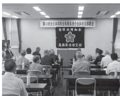
全日本同和会島根県連合会浜田支部総会が開催されました(6月20日)