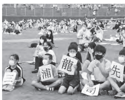
三浦龍司選手応援パブリックビューイングが開催されました(6月26日)