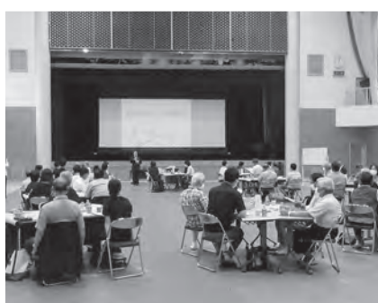
元気な浜田づくり市民委員会を開催しました(6月27日)