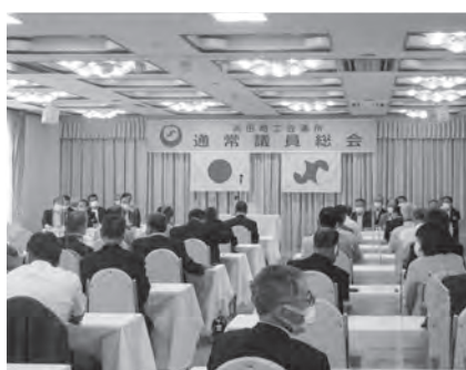
浜田商工会議所通常議員総会が開催されました(6月25日)