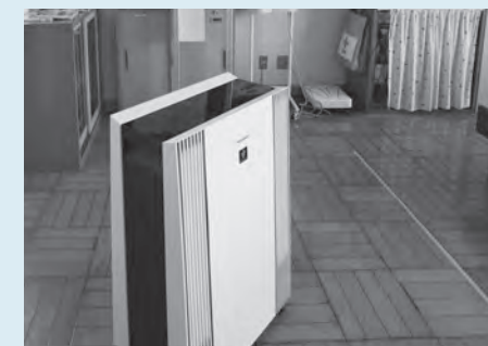
空気清浄機を設置