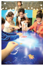
次世代型ゲーム作品

「この秘密展」では、ユニークな現代美術作品を楽しむことができます。「うれCゾーン」「たのCゾーン」「うつくCゾーン」に分けて4つある部屋をそれぞれ20分ずつ鑑賞していきます。「たのCゾーン」には、次世代型ゲーム作品や非接触の体験型デジタルアートが登場！新しい発想の作品との出会いはワクワクがたっくさん詰まっています。ご家族そろってぜひ、お出かけください。