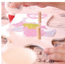
カラーサンドで飾る壁掛け