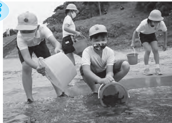
ヒラメの稚魚を放流する

ヒラメの稚魚約2000尾を「大きくなって帰ってきてね」と言いながら、次々に放流しました。参加した児童は、「初めてヒラメに興味を持った。ヒラメがとてもかわいく思えた。元気に大きく育ってほしい」と話していました。