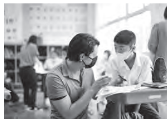
A L Tによる授業風景

A L T（外国語指導助手）を小中学校に配置し、外国語教育の充実・推進を図りました。また、特別な支援が必要な児童生徒や、外国籍児童の日本語指導に対応するため、学校支援員を配置し、学級運営の円滑化を図りました。