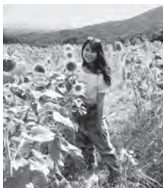
野山嶽ひまわり園にて

2019年の夏に浜田市に初めて来ました。太陽の明るい光、青い空に浮かぶ雲が印象的な日でした。あの景色は本当に「グリーンサマー」に参加した日々を思い出させてくれました。浜田に来た当時は、何もかもが新しく誰も知らなくて、不安でいっぱいだった私は浜田で生活していけるか心配していました。しかし、浜田市の皆さんの熱心なサポートのお陰で無事に国際交流員の任期を終えることができました。国籍、年齢、性別などに関わらず、皆さんと仲良くできて、すてきな思い出がたくさんできました。私にとって、2年間はあっという間で、浜田市は第2の安らかなふるさとなりました。もうすぐ浜田を離れなければならない、とても残念ですが、浜田での思い出と皆さんのことを一生忘れません。皆さんも幸せな夏を過ごされますように。また、会いましょう！