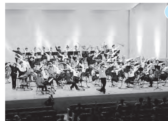
浜田高等学校吹奏楽部との合同ステージ