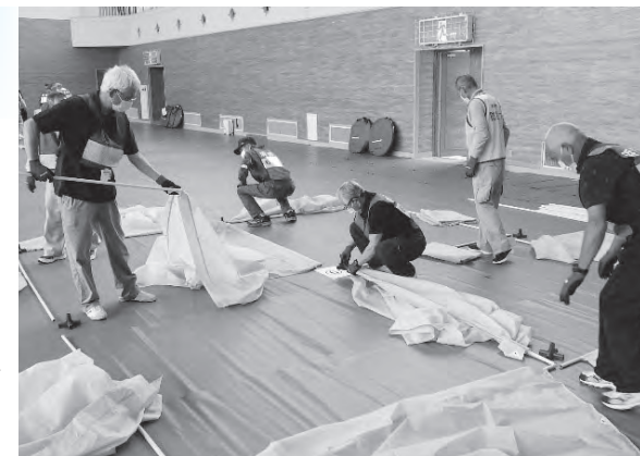
間仕切りを組み立てる

訓練参加者は、「1年に数回は防災訓練が必要であり、災害に備えて、連絡網の確認や避難先の把握をすることができました。今後も続けていきたい」と話していました。