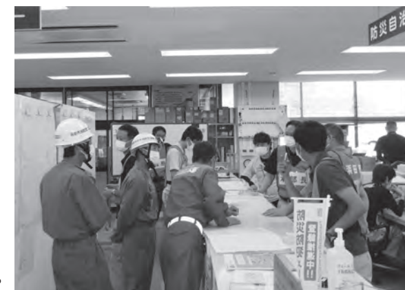
安否確認の報告を受ける