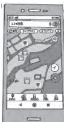
端末の画面イメージ

目の前で人が倒れた場合、近くのAEDを探す必要があります。ご自身のスマートフォンなどにあらかじめ登録しておけば、いざというときに便利です。