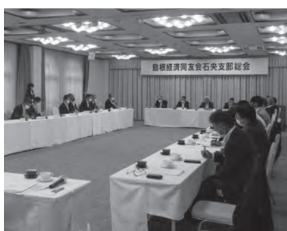
島根経済同友会石央支部総会が開催されました(6月18日)