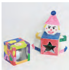
不思議！ コインが消えるよ

入れたコインが消える不思議な貯金箱づくりに挑戦しよう。 ◎12日(木)～14日(土) 参加費 300円