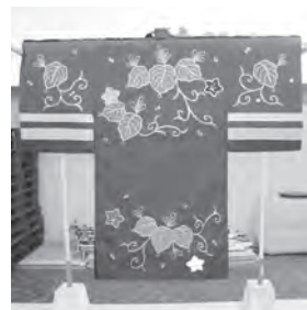
神楽衣裳などの用具

浜田市内で石見神楽を保存・継承する団体に対し、衣裳など用具の新調及び更新の費用負担を軽減しました。また、石見神楽団体の上演を撮影した映像を石見ケーブルビジョン「神楽ざんまいアワー」で放送しました。