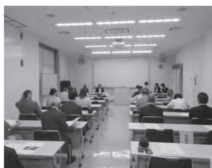
浜田国際交流協会総会が開催されました(6月26日)