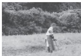
草刈・清掃による河川環境整備

市道を常時良好な状態に保ち、安全で快適に通行できるよう維持修繕し、管理を行いました。また、河川の清掃や草刈りを実施し、良好な環境を維持しました。