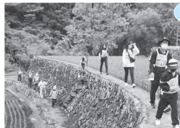
棚田の風景を満喫する参加者