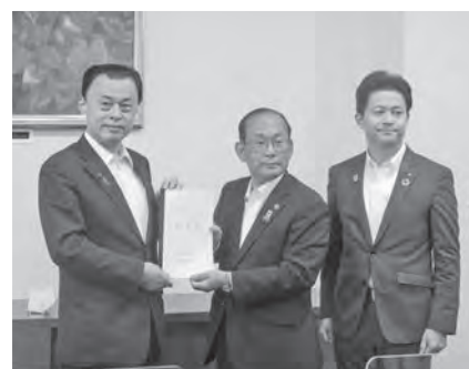
島根県知事に島根県市長会の要望活動 を行いました(10月26日)