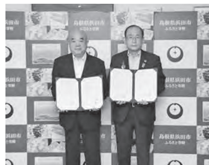
長福寺(内村町)及び美川保育園と災害 時における避難所の指定及び使用に関 する協定を締結しました(10月4日)