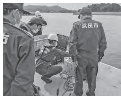
島根県総合防災訓練に出席しました (10月24日)