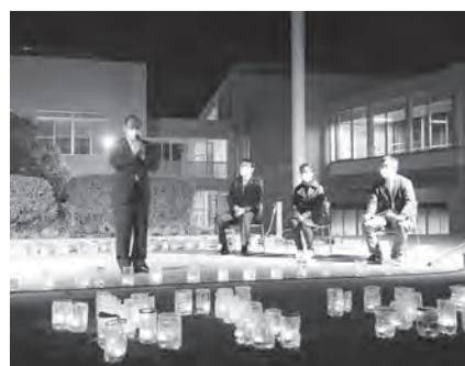
はまだ灯に出席しました(10月26日)