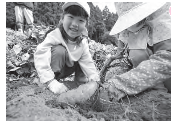
大きな芋にニコリ

参加者は約5kmのコースの各ポイントで解説を聞きながら、初秋の空の下、ウォーキングを楽しみました。