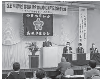
全日本同和会島根県連合会結成60周年記念研修大会 に出席しました(10月3日)