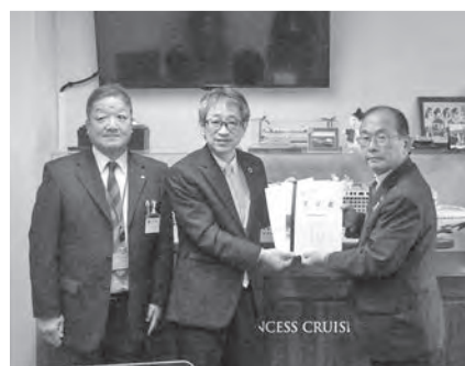
国土交通省港湾局長に港湾整備につ いての要望活動を行いました(10月20日)