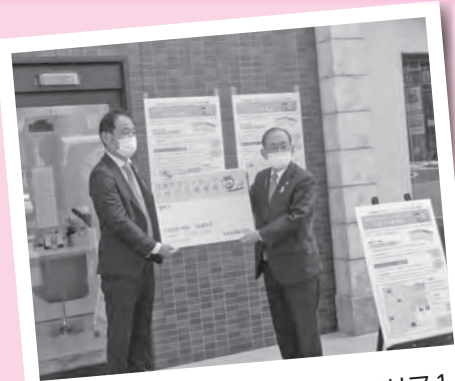
はまだマリンエリア・アクアスエリア1 日バス乗車券販売開始セレモニーに出席 しました(10月1日)