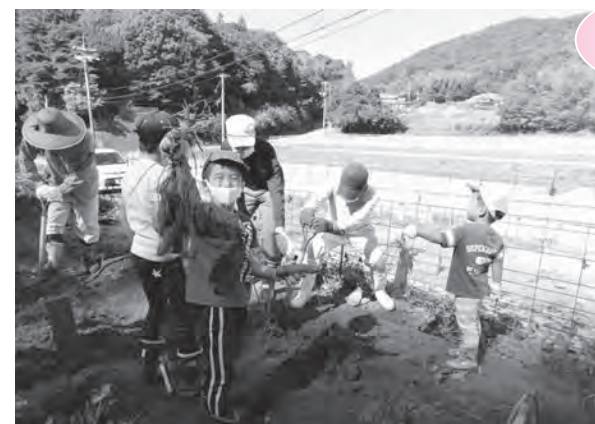
たくさんの芋に大喜び