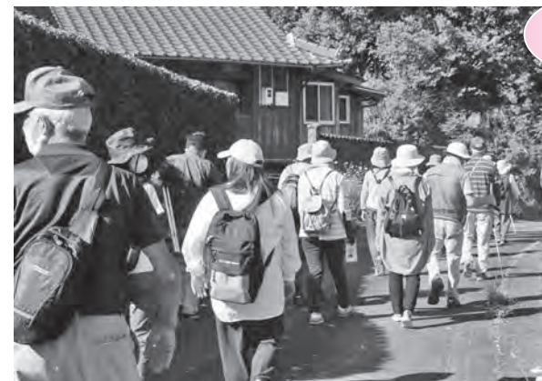
ウォーキングを楽しむ参加者