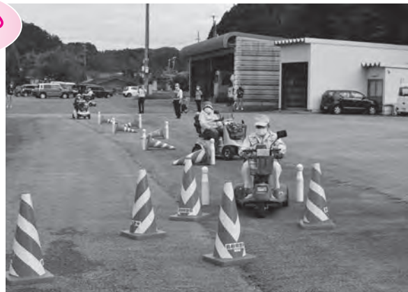
ジグザグコースを走行する