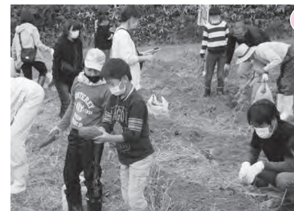
芋の収穫を楽しむ参加者