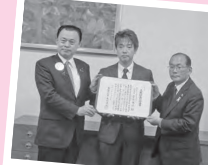
㈲吉原木工所が島根県から企業立地計画 の認定を受け、同社と県と浜田市が覚書 に調印しました(10月29日)