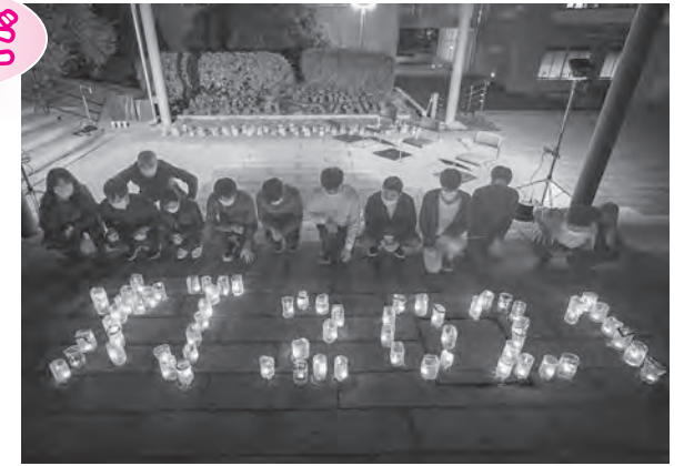
事件の風化防止を誓い、キャンドルを見つめる

当日は、はまだを明るく照らし隊や島根県立大学の防犯サークルSCOTのメンバーが、灯した約150個のろうそくの明かりを囲み、事件の風化防止を誓い、被害者の冥福を祈りました。