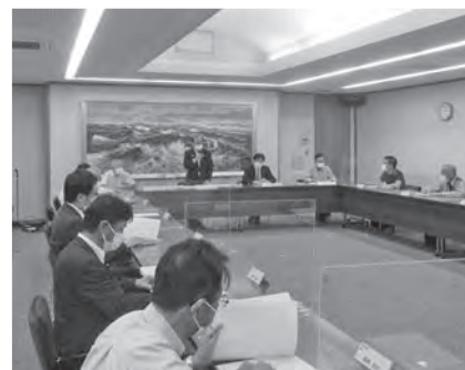
全国未成線サミットin浜田実行委員会を 開催しました(10月5日)