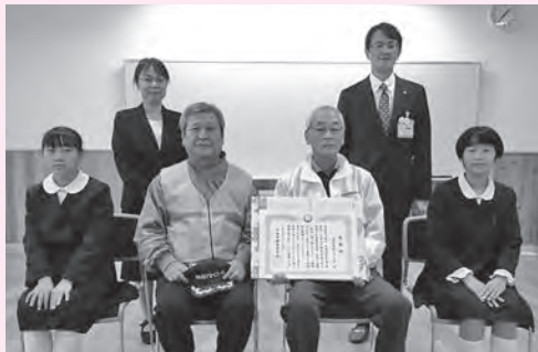
○旭小学校 被表彰者 旭地区防犯パトロール隊