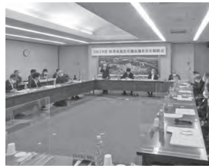
島根県市議会議長会定期総会に出席し ました(10月4日)