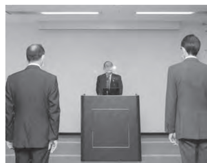
市長就任後、初登庁をし職員に訓示を述 べました(10月18日)