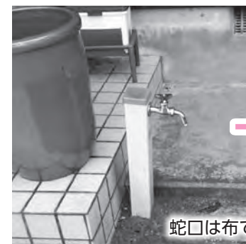
蛇口は布でしっかり防寒を