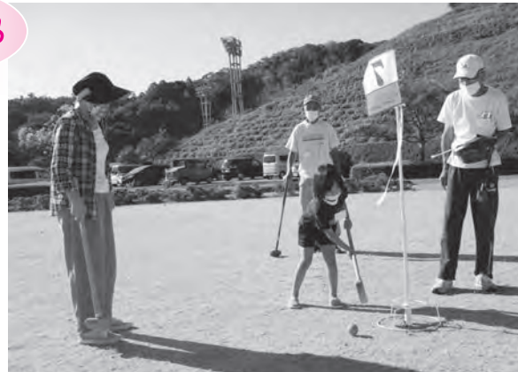
グランドゴルフを楽しむ参加者

晴天にも恵まれ、参加者は「この日を待っていました」と張り切ってプレーしていました。競技初心者も経験者も一緒になって、1打1打、1球1球全集中で挑み、笑いあり、スーパープレーありと、今年も大盛況でした。