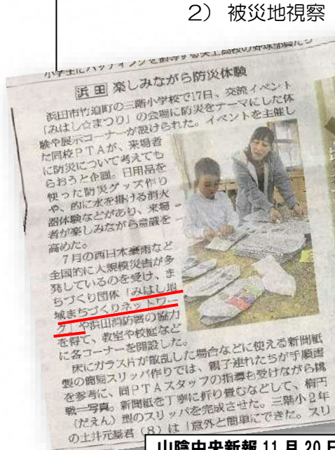
山陰中央新報 11 月 20 日