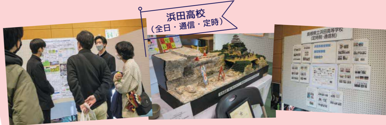
浜田高校 (全日・通信・定時)

各高校の学びを体験できるブースやポスター展示のほか、高校生自ら企画したブースも！今回はその一部をご紹介します！