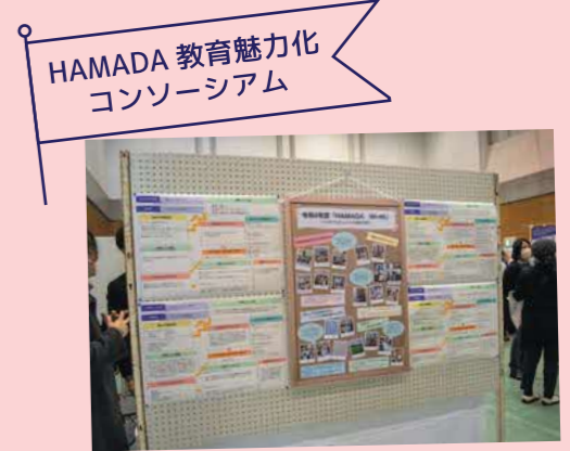
HAMADA 教育魅力化 コンソーシアム

浜田高校全日制は、自然科学系コンテストに入賞した研究ポスター(写真左)を展示し、生徒によるポスター発表も行いました！また通信制では、第14回全国高等学校鉄道模型コンテストに入賞したジオラマを実物展示。(写真中央)定時制はグループ別自主研修の様子や研修作品を展示しました。(写真右)