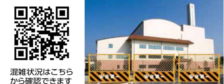
混雑状況はこちら から確認できます

※浜田地区広域行政組合ホームページで施設内の混雑状況を確認できます(配信日：施設開場日 午前9時~午後4時30分 YouTube掲載)