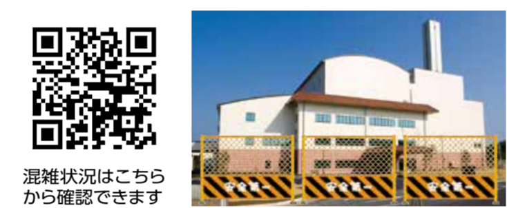
混雑状況はこちらから確認できます

※浜田地区広域行政組合ホームページで施設内の混雑状況を確認できます(配信日：施設開場日 午前9時~午後4時30分 YouTube掲載)