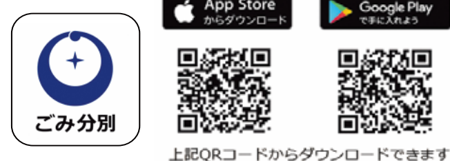
上記QRコードからダウンロードできます