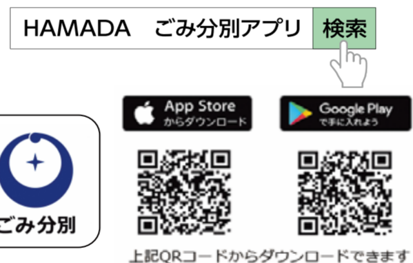
上記QRコードからダウンロードできます

QRコードを読み取り、ダウンロードページへ移動し、アプリをインストールしてください。