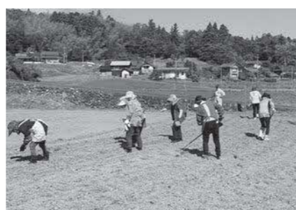
地域による農地有効活用(ひまわり栽培)

地域の課題解決に向け、住民と行政の協働による継続した活動につながるよう、支援します。