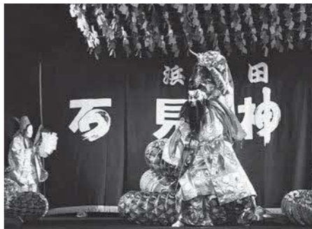
日本遺産の石見神楽

月に、東京で石見神楽国立劇場公演を開催します。首都圏での認知度向上に努め、本場・浜田市への誘客につなげます。また、2025年開催の大阪・関西万博での公演を視野に、PR活動に取り組みます。