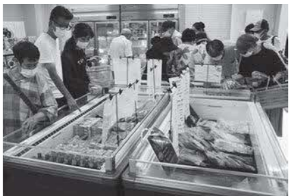
はまだお魚市場 グランドオープン

将来にわたり水産浜田として生き残るためには、地元漁船の存続が重要です。特に、老朽化が進む沖合底びき網漁船団には、令和4年度、島根県と連携して新船建造を支援し、事業継続を