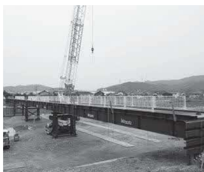
仮設歩道橋建設中の周布橋

令和4年度は、私にとって市政運営3期目の本格稼働の年です。近年ますます多様化する行政課題に、国や県の支援も得ながら近隣市町と連携し、諸課題の解決に取り組めます。