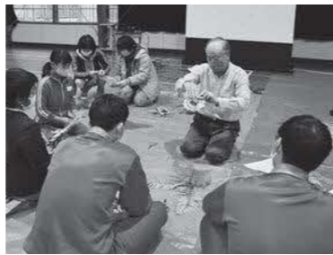
まちづくりセンターの活動「しめ縄づくり」