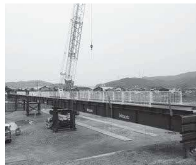
仮設歩道橋建設中の周布橋

令和4年度は、私にとって市政運営3期目の本格稼働の年です。近年ますます多様化する行政課題に、国や県の支援も得ながら近隣市町と連携し、諸課題の解決に取り組めます。