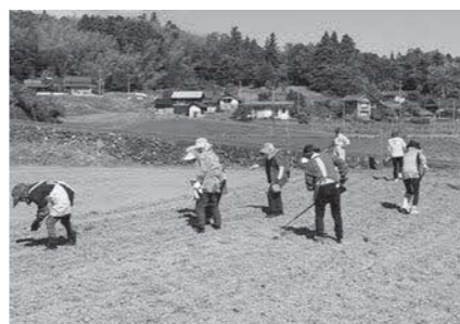
地域による農地有効活用(ひまわり栽培)

地域の課題解決に向け、住民と行政の協働による継続した活動につながるよう、支援します。