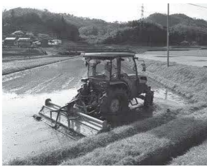
農事組合法人による農作業

ほ場整備事業については、令和4年度に杵束地区の採択申請を行う予定です。 有機米の産地化では、令和4年度に実証ほ場を設置し、民間企業や島根県の協力も得て、安定生産と高付加価値化を図ります。 農産物の加工では、米を原料とした農産品の開発や販売促進のほか、イノシシ肉の販路拡大に取り組みます。 ②新しい協働によるまちづくり 令和3年4月に2つのまちづくり推進委員会が1つになり、