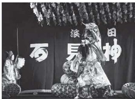
日本遺産の石見神楽

月に、東京で石見神楽国立劇場公演を開催します。首都圏での認知度向上に努め、本場・浜田市への誘客につなげます。また、2025年開催の大阪・関西万博での公演を視野に、PR活動に取り組みます。