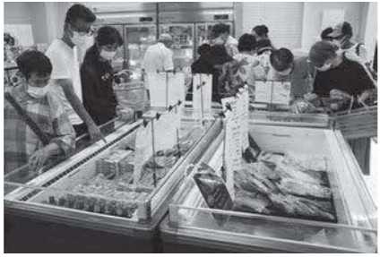
はまだお魚市場 ブランドオープン

令和3年7月のブランドオープン以降、県内外からの来場で、にぎわっています。指定管理者や水産関係者と連携し、更なるにぎわい創出に努めます。