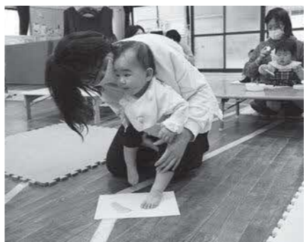
「すくすく」の活動に参加する親子

少子化の大きな要因として、若者の減少が挙げられます。その対策として、令和3年度から、若者の「出会い・結婚・出産・子育て」をトータルで応援する事業に取り組んでいます。また、新たに、結婚したカップルや赤ちゃん誕生世帯への応援金、第3子以降の保育料及び保育所などの給食費の無償化を始め、令和4年度からは、子ども医療費の助成を、これまでの中学生から18歳までに拡充します。