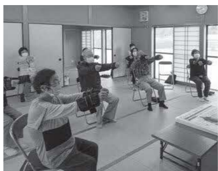
いきいき百歳体操

「第4次浜田市健康増進計画」及び「第4次浜田市食育推進計画」を策定し、はまだ健康チャレンジ事業や、いきいき百歳体操の普及に取り組みます。