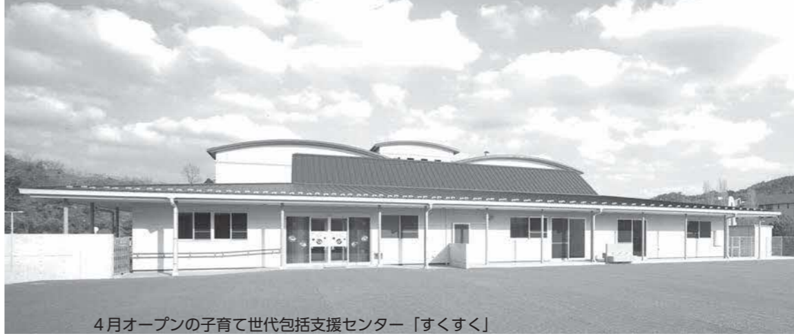
4月オープンの子育て世代包括支援センター「すくすく」

また、まちづくりセンターやまちづくりコーディネーターと連携し、引き続き、地区まちづくり推進委員会の設立や活動に対する支援を行います。