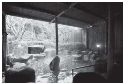
美又温泉 露天風呂

昨年11月、「第3回全国未成線サミットin浜田」を開催しました。今後、広浜鉄道今福線を活用した観光誘客に取り組みます。石見神楽については、本年7