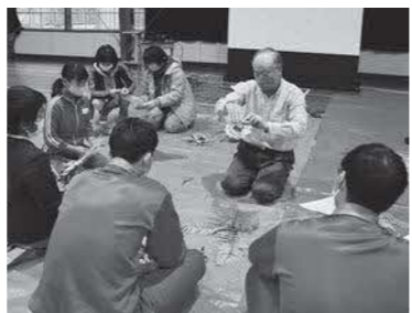
まちづくりセンターの活動「しめ縄づくり」