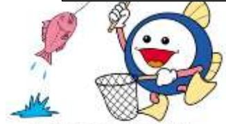
下水道マスコットキャラクター 「スイスイ」