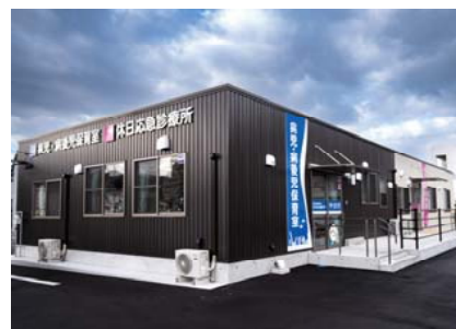
休日診療所整備事業、病児・病後児保育室整備事業 （令和3年度事業費 9,106万円）