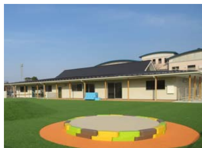
子育て世代包括支援センター整備事業 （令和3年度事業費 3億804万円）