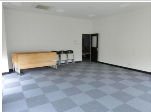
ミーティング室（出入口の対角から）