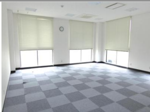
ミーティング室（出入口側から）