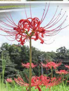
令和4年 新たなシンボル 彼岸花