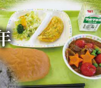
学校給食 平成30年1月 おコッペ開始 令和2年10月 トマト提供