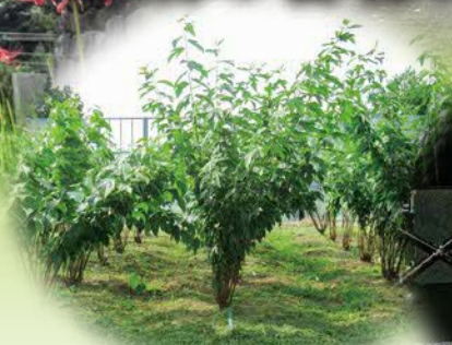
平成31年3月 植栽開始