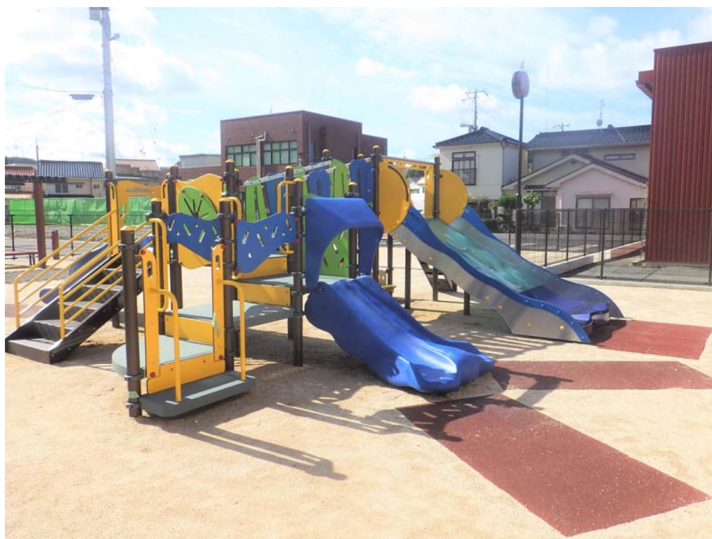
旧子育て支援センター跡地に整備した「松原公園」 (令和6年11月開園)

住みたい 住んでよかった 魅力いっぱい 元気な浜田 ～ 豊かな自然、温かい人情、人の絆を大切にするまち ～