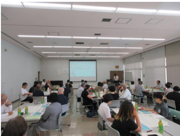
（7 月 16 日の様子）